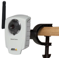
Caméra réseau AXIS 207/207W/207MW avec pince flexible (incluse)