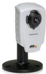
Caméra réseau AXIS 207/207W/207MW avec socle (inclus)